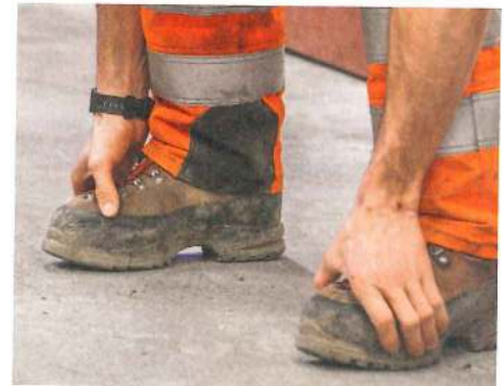
7.10 Uhr: Morgendliches Einturnen im Werkhof in Wartau